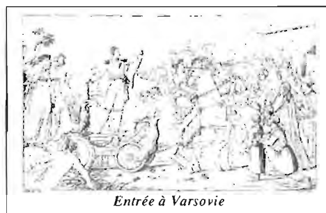
Entrée à Varsovie