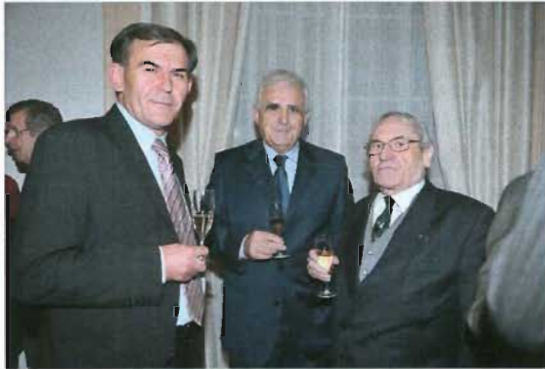
Réception à l'Ambassade de Croatie : le Président de l'ACMN s'entretenant avec le Ministre croate des Anciens combattants, et l'Ambassadeur de Croatie en France

Elle a été précédée par la tenue en Croatie, à Zagreb et Zadar, du 1 er au 3 octobre de cette année d'un colloque international intitulé « Les Croates et les Provinces Illyriennes » auquel participèrent les meilleurs spécialistes français de l'histoire napoléonienne. Ce colloque a dévoilé des aspects peu connus de ce pan important de l'histoire franco-croate, qui mériterait d'être davantage approfondie.