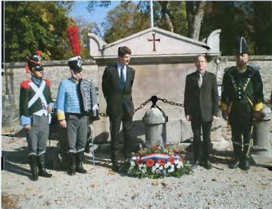
Dépôt de gerbe par le Premier secrétaire sur la tombe du maréchal Marmont à Châtillon-sur-Seine

Cérémonie en souvenir des généraux d'empire Marc Slivarich de Heldenbourg et Michel Marie Claparède à l'occasion du bicentenaire des Provinces Illyriennes (1809-1813) Gignac > Mercredi 16 septembre 2009