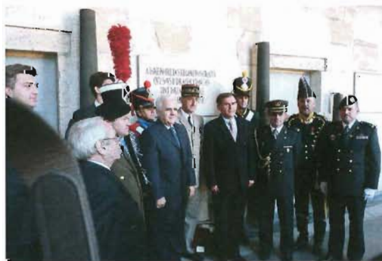
La cérémonie aux Invalides devant la plaque à la mémoire des régiments croates. Devant le Général d'armée Cuhe Gouverneur militaire des Invalides, l'Ambassadeur et le Ministre, derrière le plumet le Premier secrétaire.

cravate, attribut vestimentaire incontournable de la mode masculine, tire son origine de la bande d'étoffe portée par les cavaliers croates qui servirent dans le Royal Cravates .