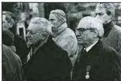
Le Secrétaire général et le Président