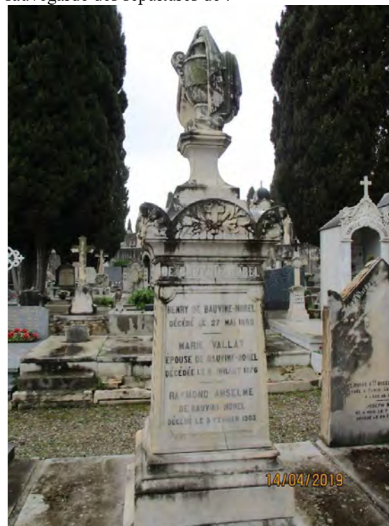
Sépulture de Pierre de Beauvine-Morel.

Intervention de l'ACMN auprès de la Mairie pour la sauvegarde des sépultures de :