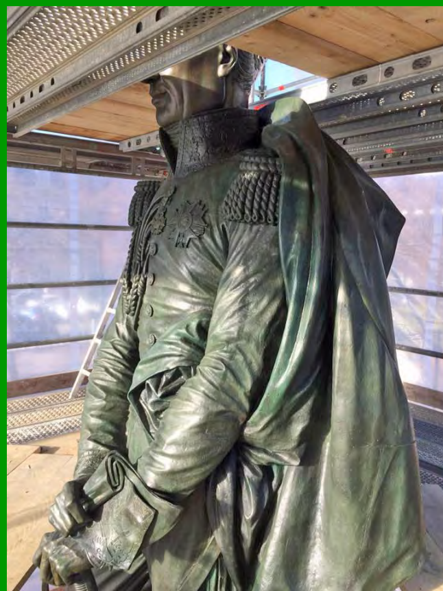
Détail de la restauration de la statue de Drouot à Nancy.