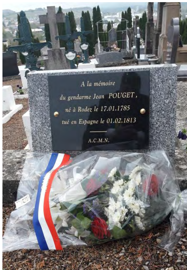
La plaque à la mémoire du gendarme Jean Louis Pouget à Rodez.