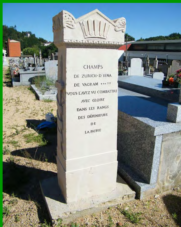
Restauration de la tombe du capitaine Jean Point à Boën-sur-Lignon (42). (Initiative privée)