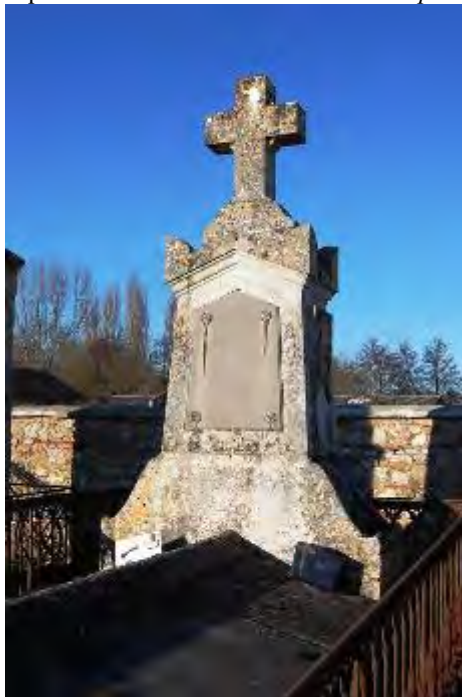
Son cœur repose dans la sépulture de famille au cimetière Beauferrier, à Bergerac.