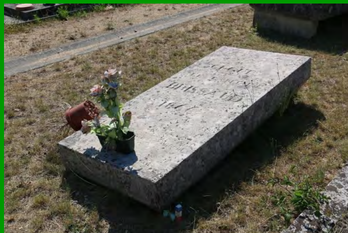
Tombe d'Henry-Éléonore Brissaud, dit Desmaillet, au Blanc (36), restaurée par le Souvenir Français.