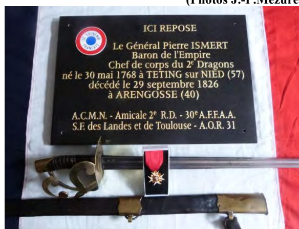
La plaque, avant sa pose, avec un sabre de Dragon modèle 1793 et sa croix de chevalier de Saint-Louis.