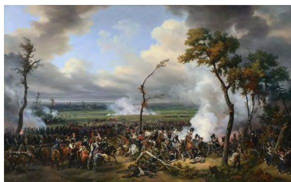
On ne peut évoquer la carrière de Drouot sans parler de la bataille d'Hanau, magnifiquement illustrée dans ce tableau d'Horace Vernet.

qui décide en partie de la victoire sur les armées autrichiennes.