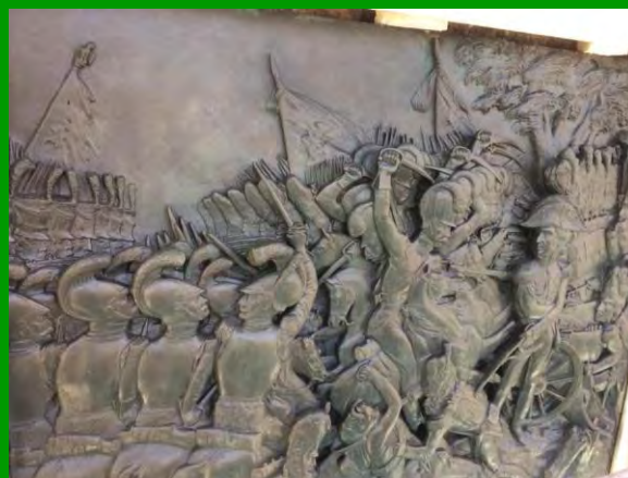
La bataille d'Hanau, détail sur la statue de Drouot à Nancy.