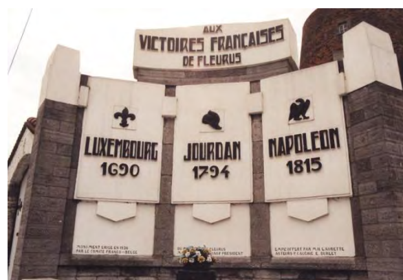
Le monument des 3 victoires de Fleurus.

Le lendemain, il est promu lieutenant-colonel en second avec le commandement du 16 e bataillon de chasseurs (futur 16 e régiment d'infanterie légère) à l'armée des Ardennes et se distingue, les 15 et 16 octobre 1793, à la bataille Wattignies. Le 27 janvier 1794, il est nommé, directement, général de brigade sans être passé par le grade de colonel. Au cours de cette même année, il commande les places fortes de Rocroi et de Sedan en mars puis de Philippeville en mai. Placé à la tête de la 1 ère brigade de la division du général Mayer, il se couvre de gloire, le 26 juin 1794, à la bataille de Fleurus où il est blessé.