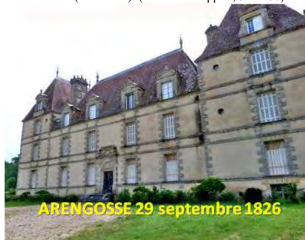
Le château d'Arengosse, où il est décédé.

des Anciens des Forces Françaises en Allemagne qui en est l'héritière (FNAFFA). (Cf. aussi en pp. 7, 54 et 60)