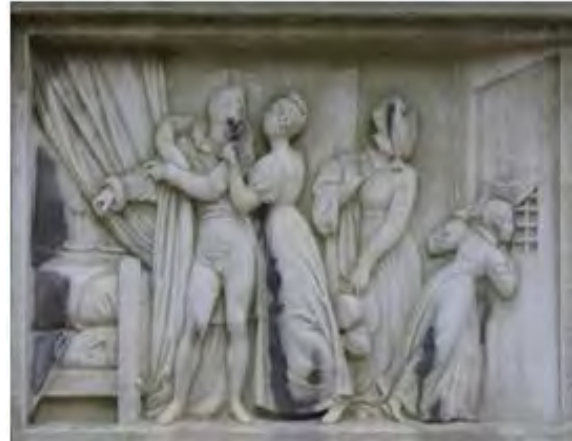
Bas-relief : l'évasion de Lavalette.