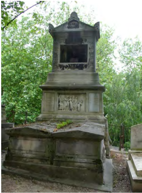
Sépulture du Comte de Lavalette