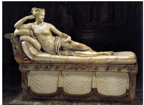
Pauline Bonaparte œuvre de Canova.

L'ombre de Pauline hante encore les lieux « nous souhaitons que les visiteurs s'en souviennent ».